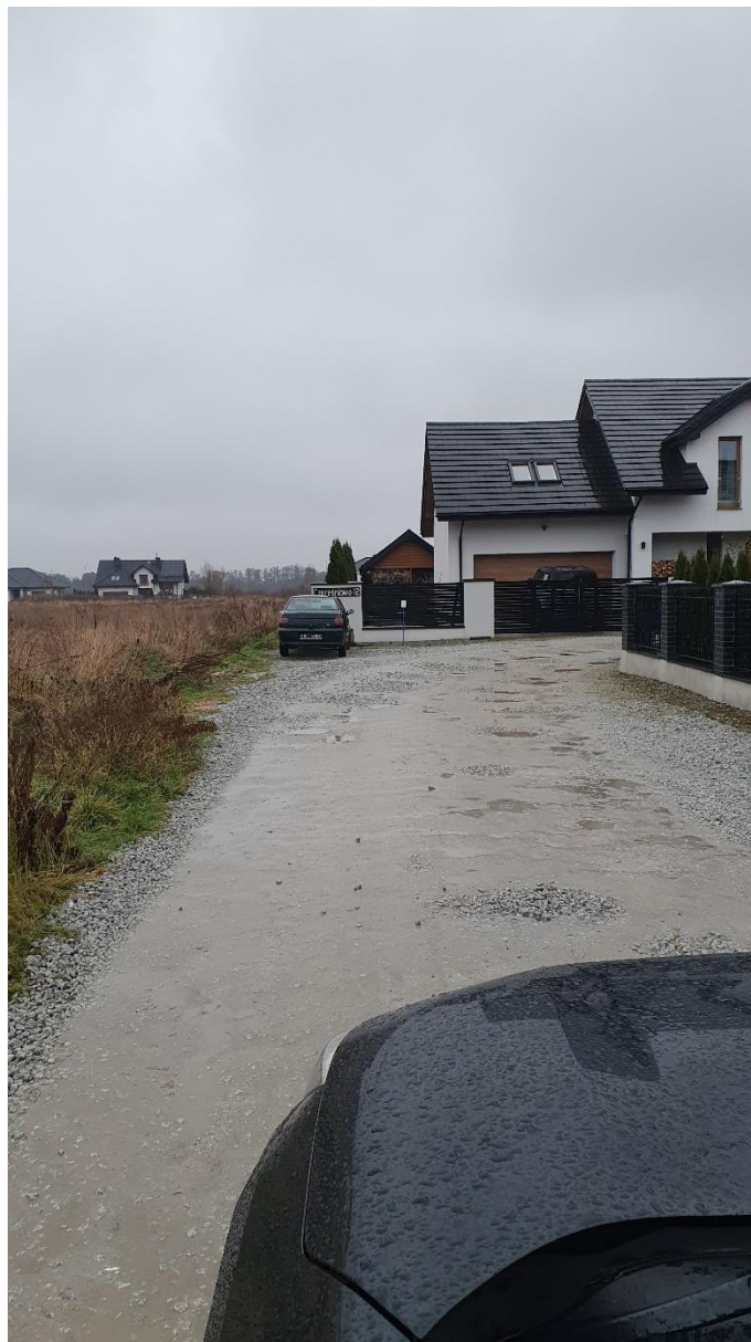
Fot. 2. Ulica Czereśniowa, źródło: opracowanie własne