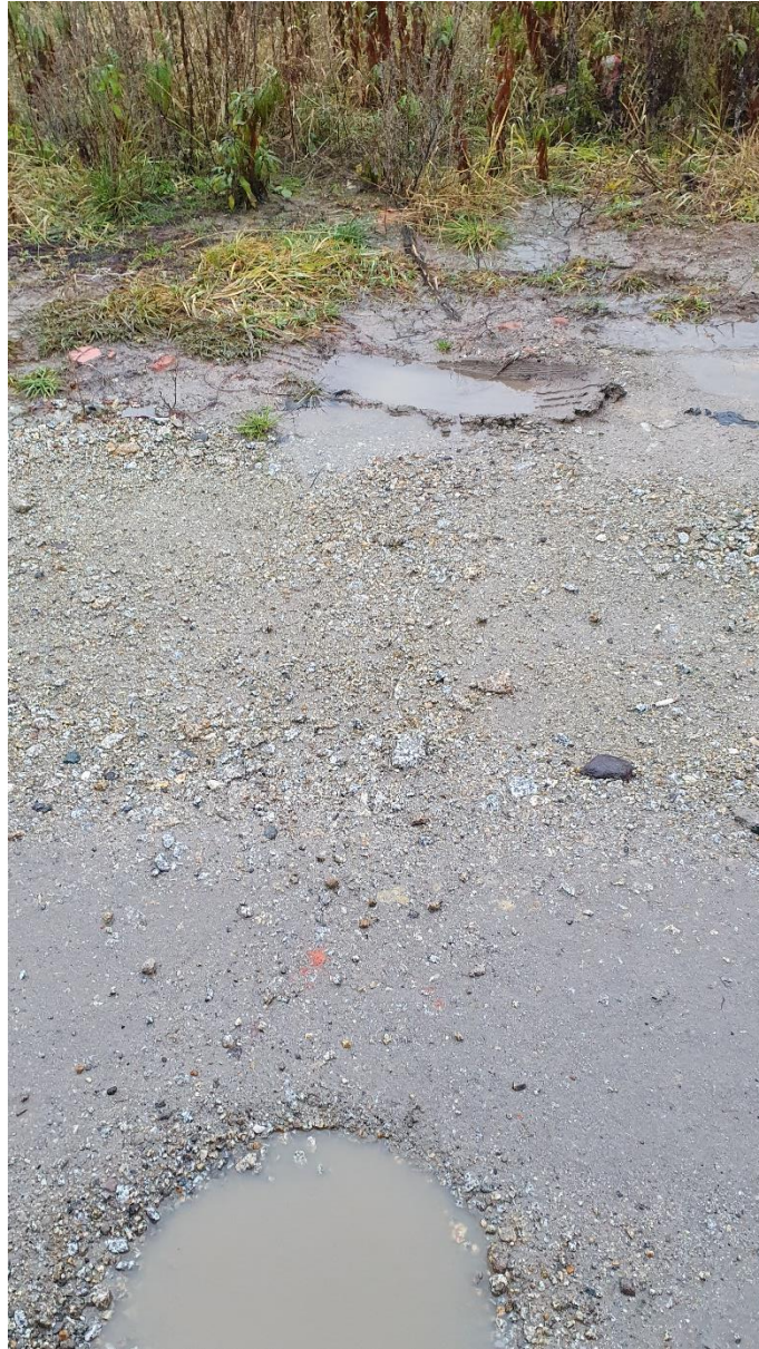
Fot. 7. Miejsce wpięcia kanału z ul. Malinowej, źródło: opracowanie własne