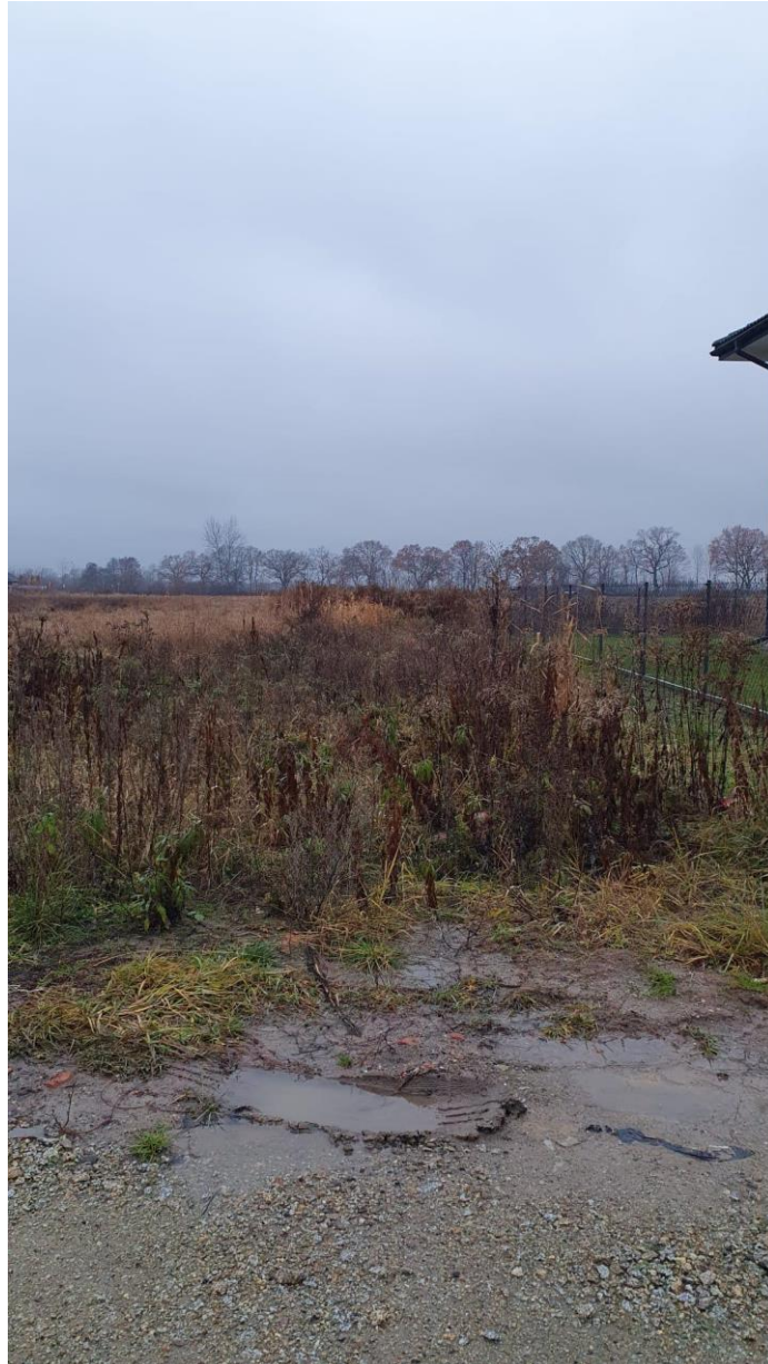
Fot. 8. Ulica Malinowa