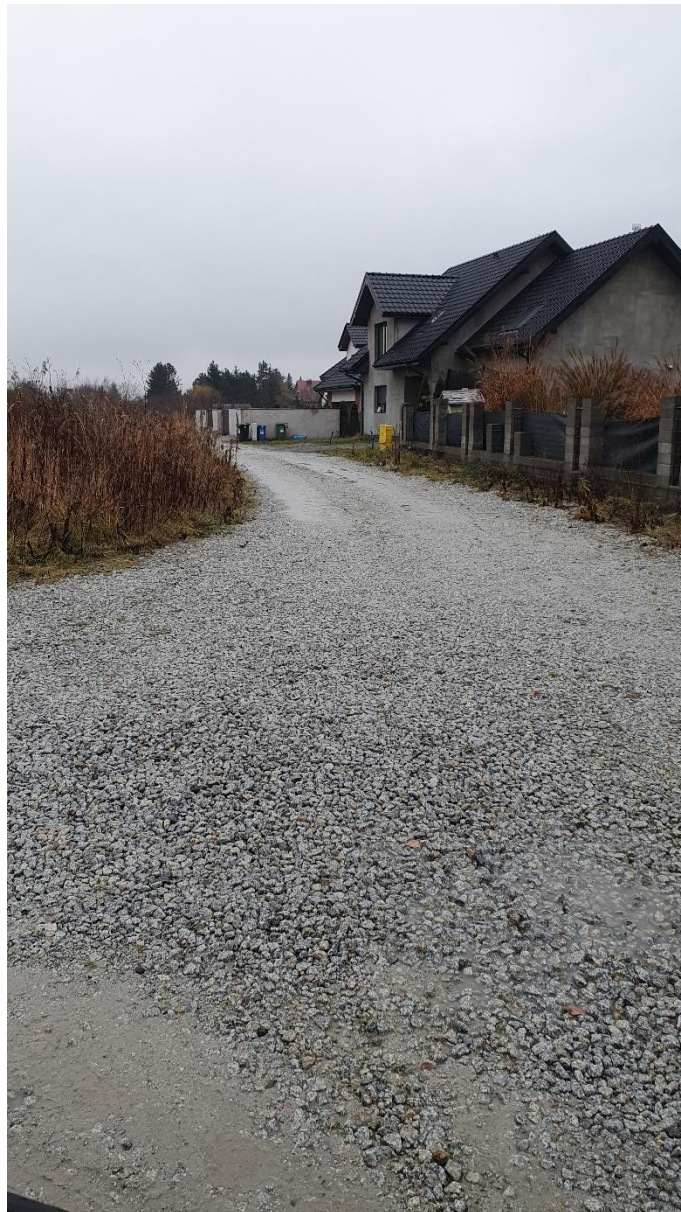
Fot. 3. Ulica Czereśniowa, źródło: opracowanie własne