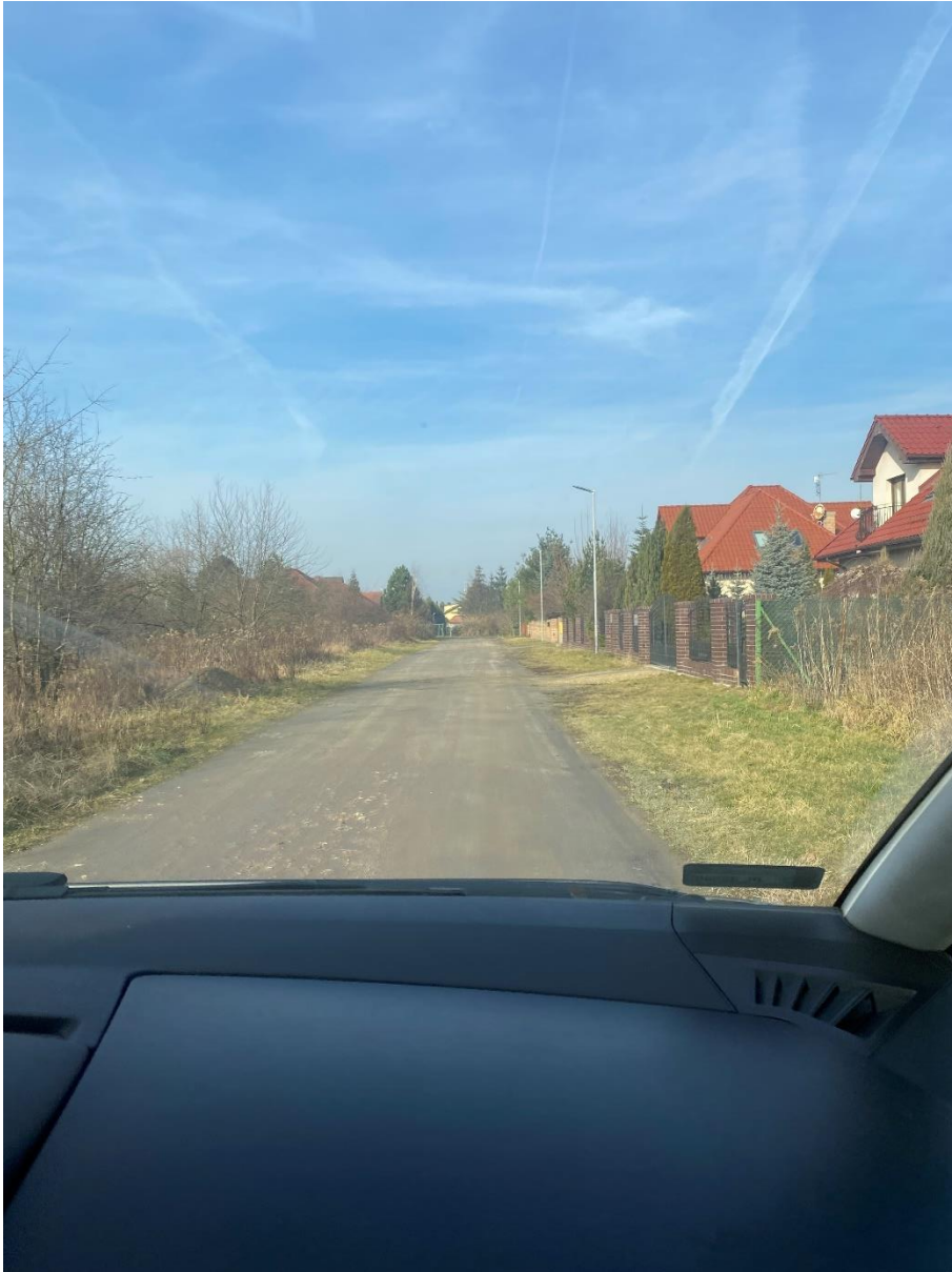
Fot. 1. Ulica Akacyjowa