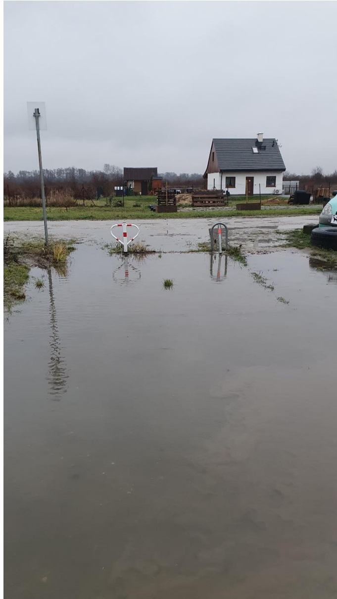
Fot. 6. Ulica Czereśniowa