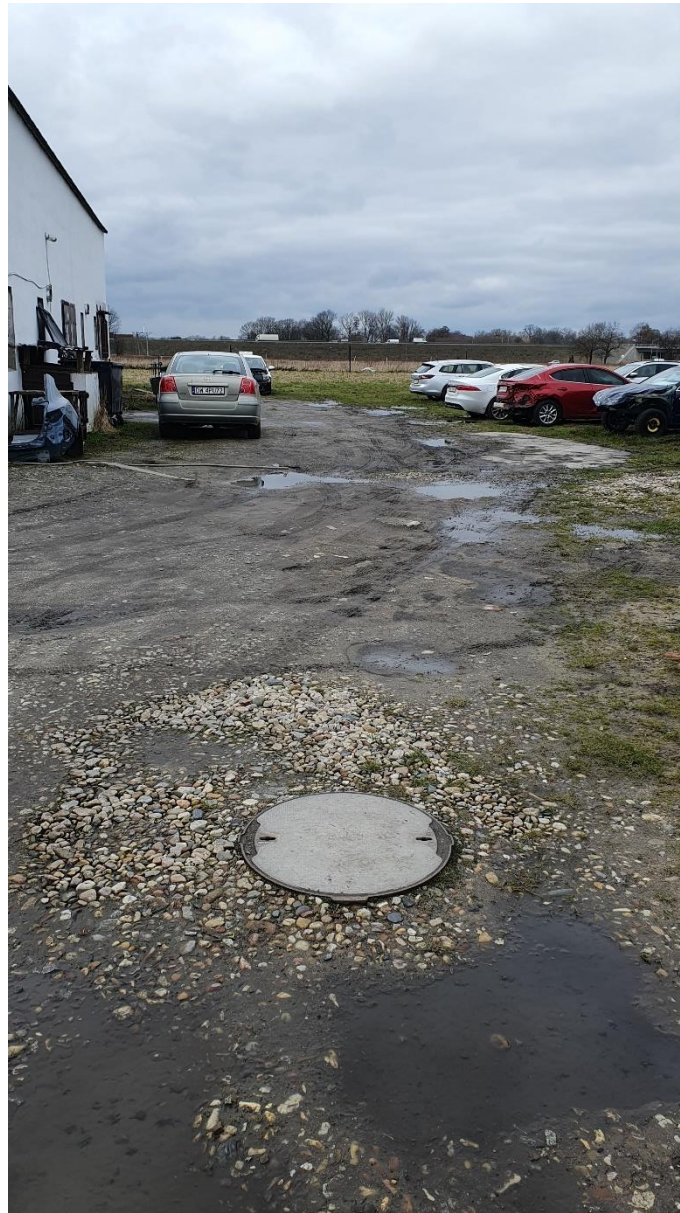
Fot. 15. Ulica Słoneczna