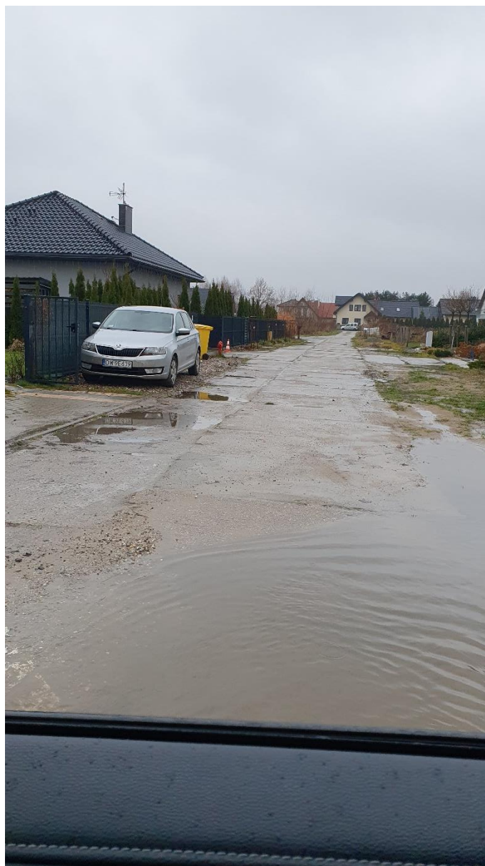
Fot. 5. Ulica Czereśniowa