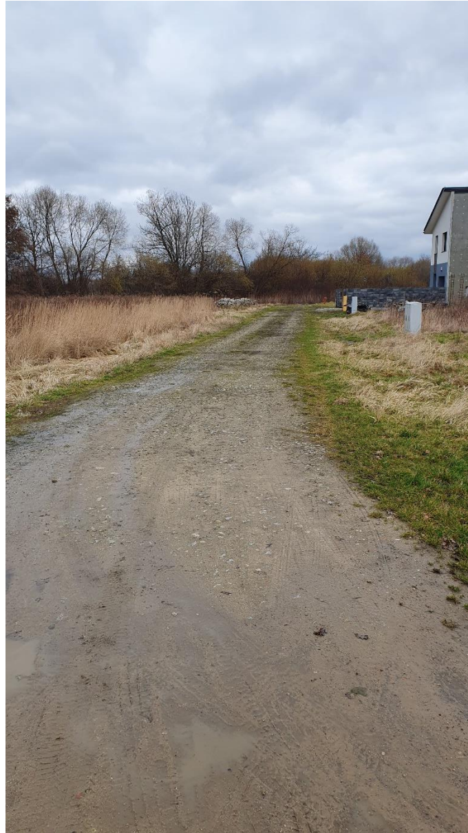
Fot. 13. Ulica Różana, źródło: opracowanie własne