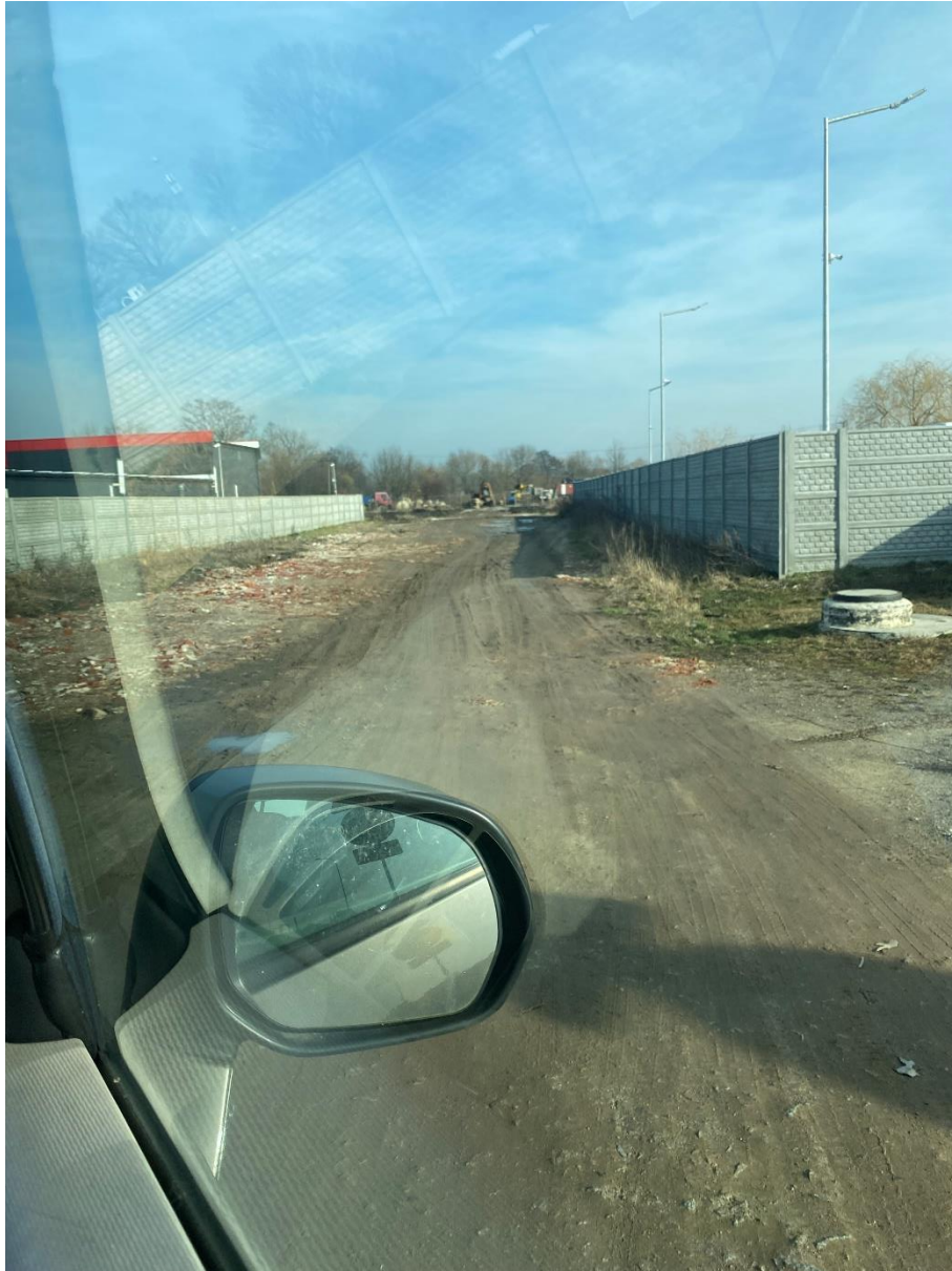
Fot. 9. Ulica Usługowa, źródło: opracowanie własne