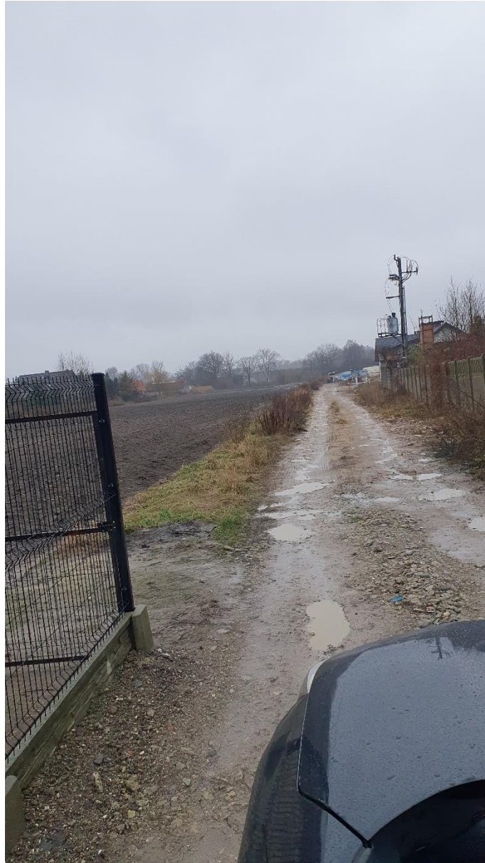
Fot. 9. Ulica Wrzosowa, źródło: opracowanie własne