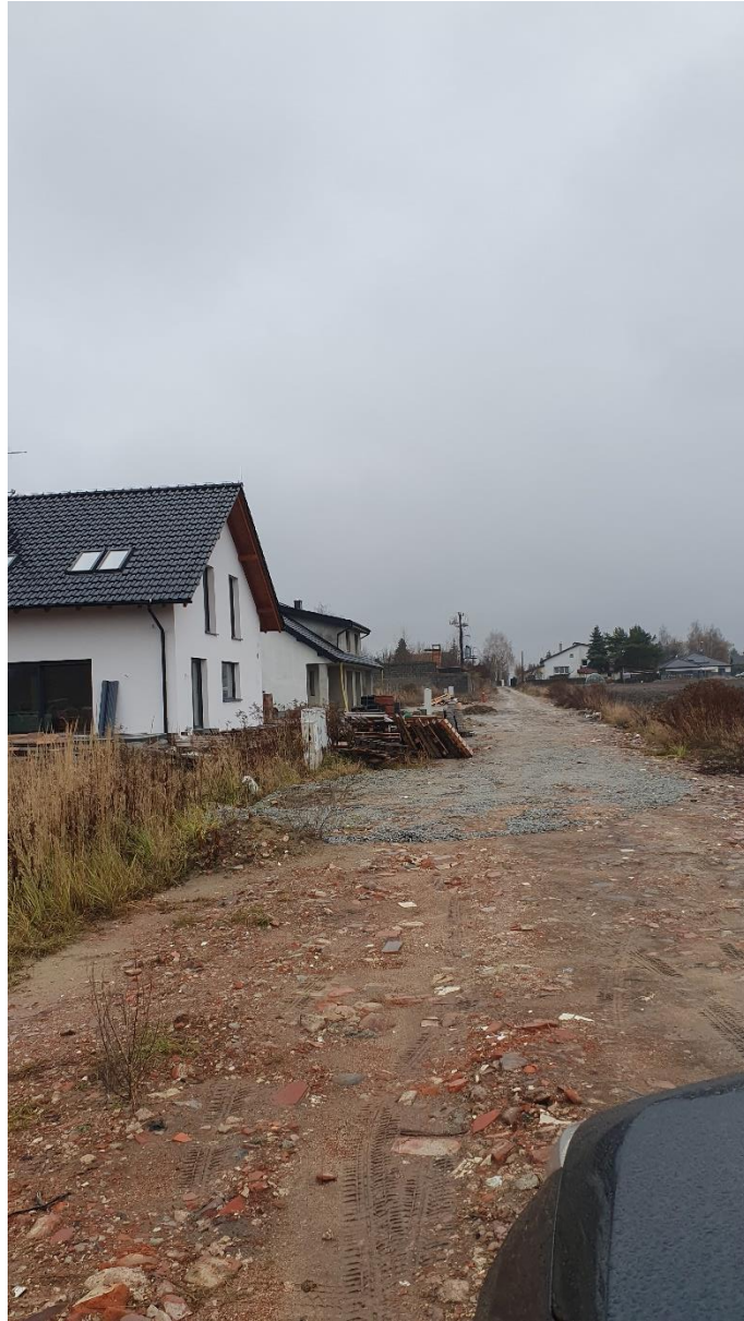
Fot. 10. Ulica Wrzosowa