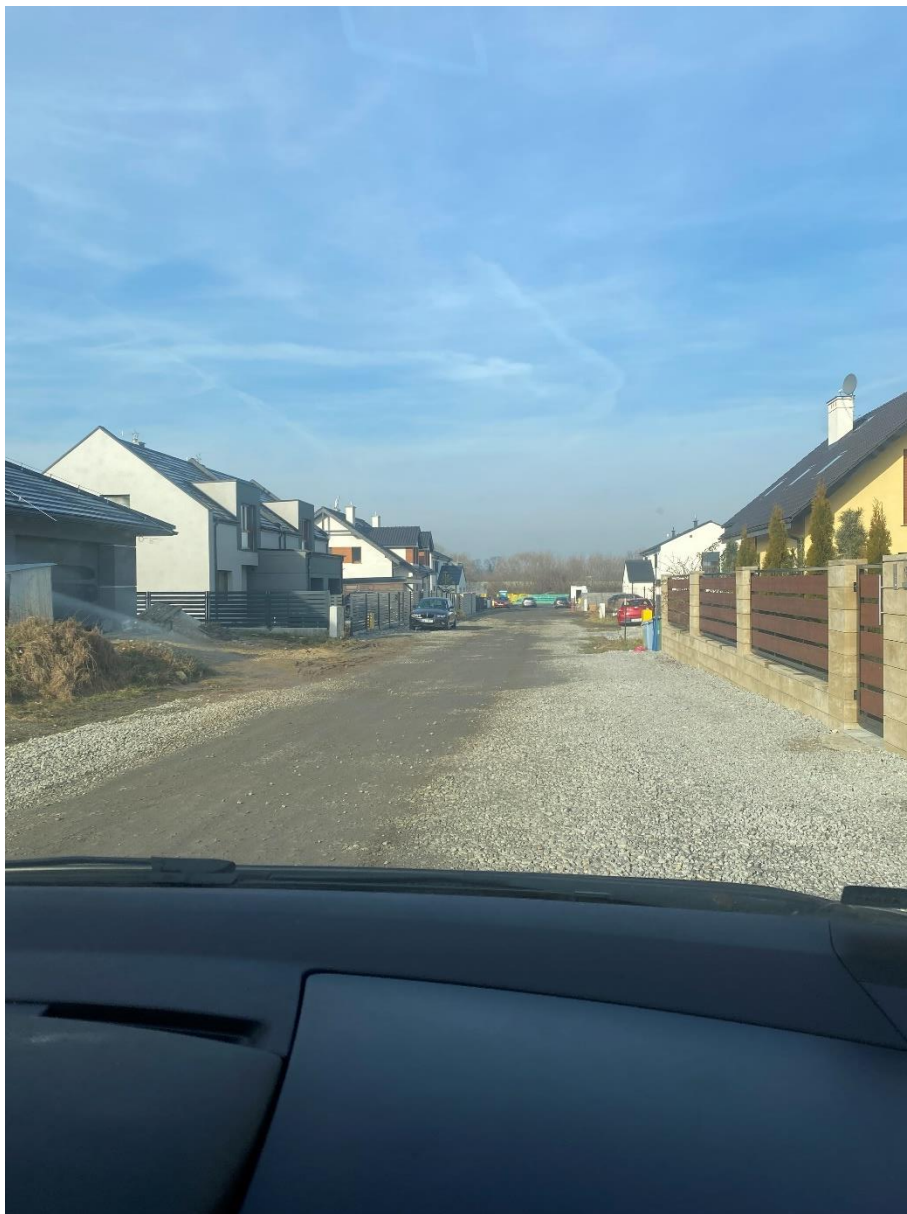
Fot. 14. Ulica Chabrowa