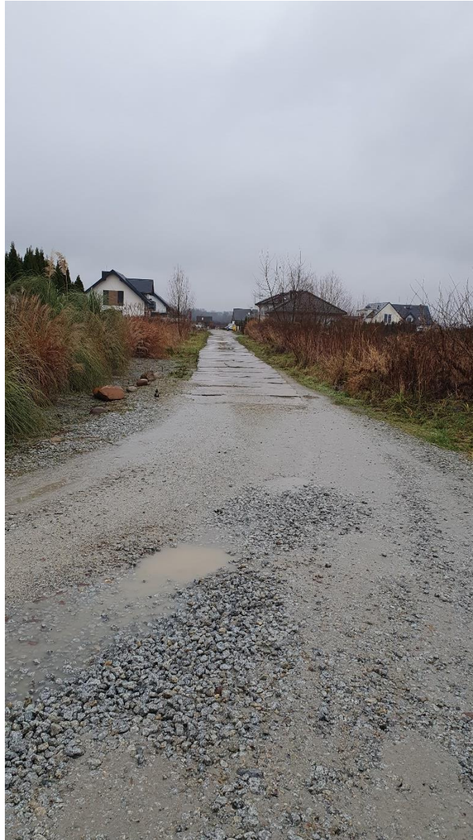
Fot. 4. Ulica Czereśniowa