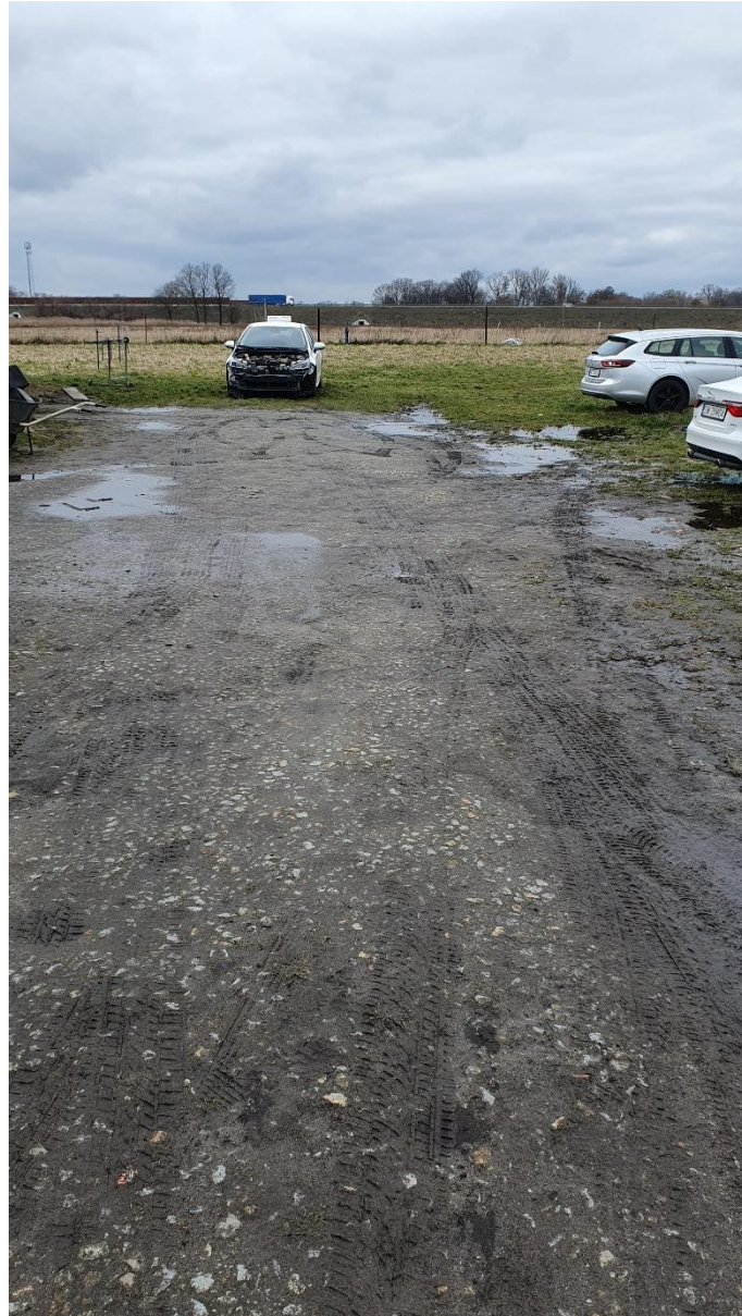
Fot. 16. Ulica Słoneczna