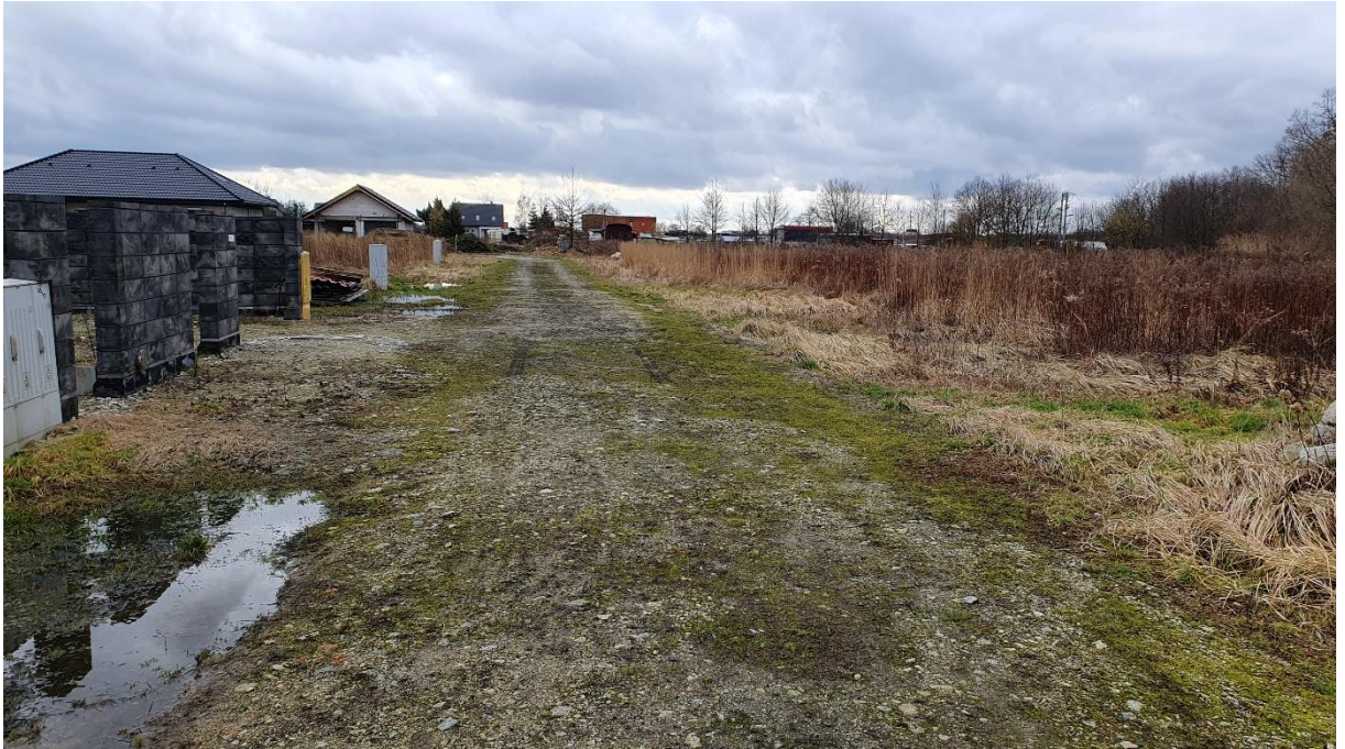
Fot. 12. Ulica Różana