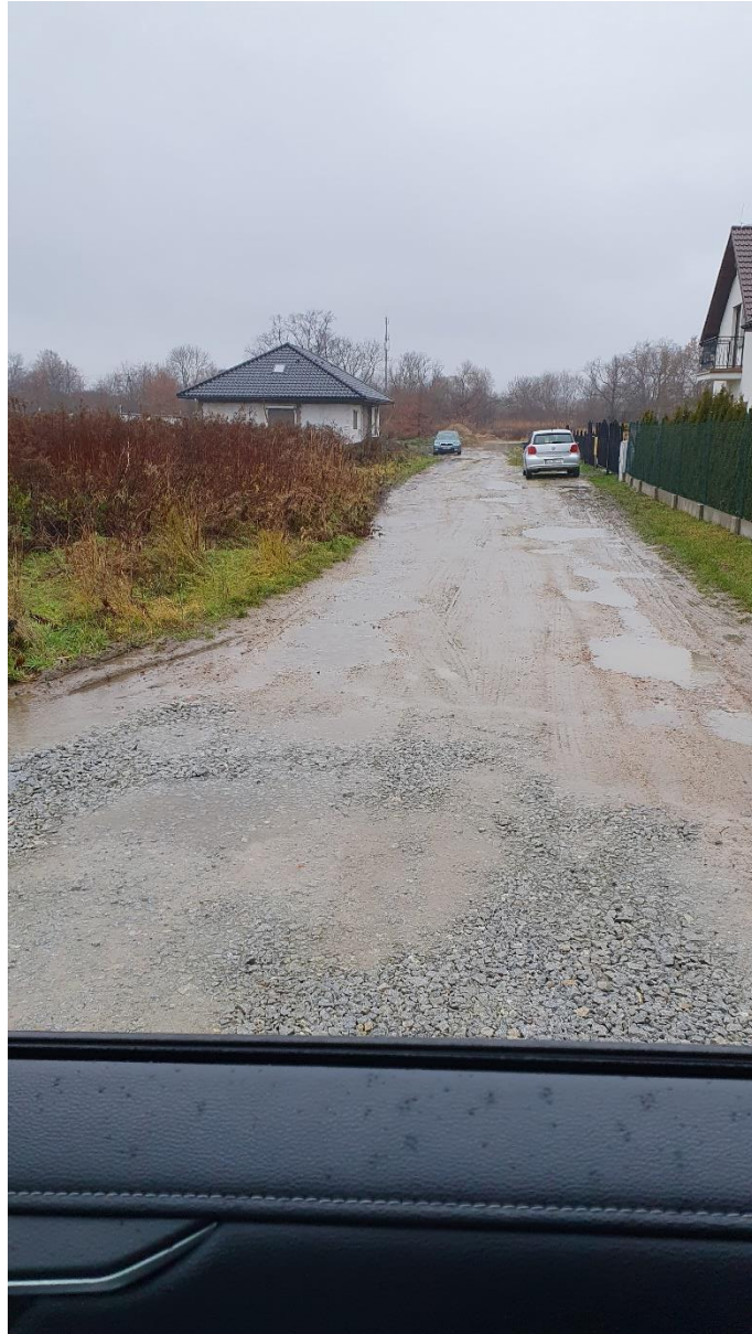
Fot. 11. Ulica Różana