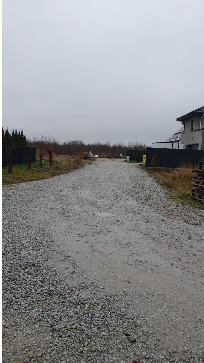
Fot. 7. Ulica Brzoskwiniowa, źródło: opracowanie własne