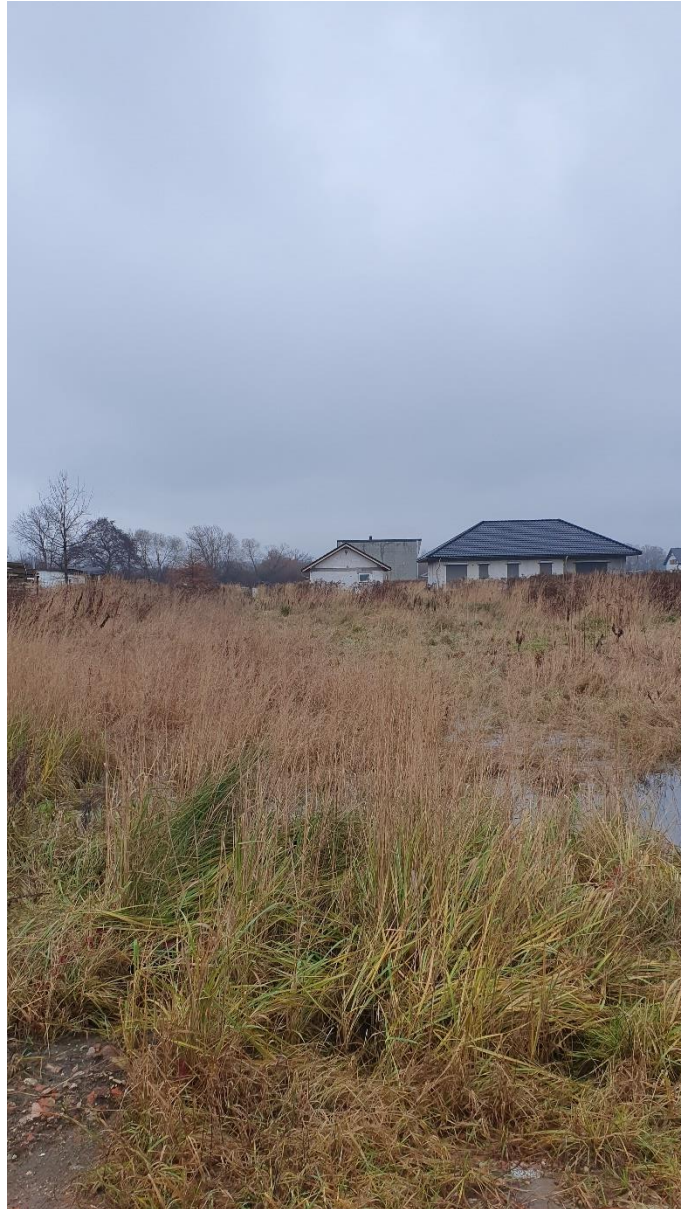
Fot. 10. Ulica Różana