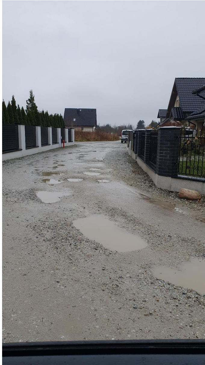
Fot. 3. Ulica Czereśniowa, źródło: opracowanie własne